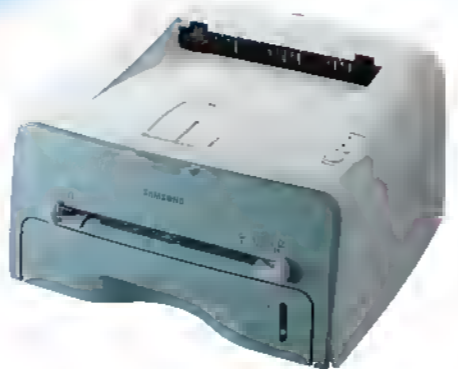
Принтери Samsung ML-1710, ML-1750